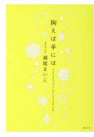
『抱えば手には』瀬尾 まいこ著 講談社, 2022年

*人の心が読める特殊な能力に気がついた大学生の梨木匠と、心を開いてくれないバイト先の常盤さん。常盤さんは、辛い秘密を抱えていたのだった…。